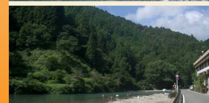
夏の川湯温泉 Kawayu open air bath in summer